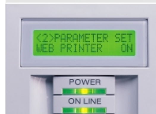
▲ Afficheur ergonomique.

Grâce à son langage basic intégré, le BCI retravaille les données pour les intégrer dans vos étiquettes. Cela permet de connecter l'imprimante sur des systèmes existants ou peu ouverts.