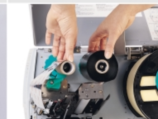
▲ Gain de temps et apprentissage minimum en raison d'une manipulation très simple.